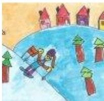
Lara Čremožnik, 1. OPB