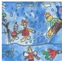
Lucija Škornik, 2. OPB